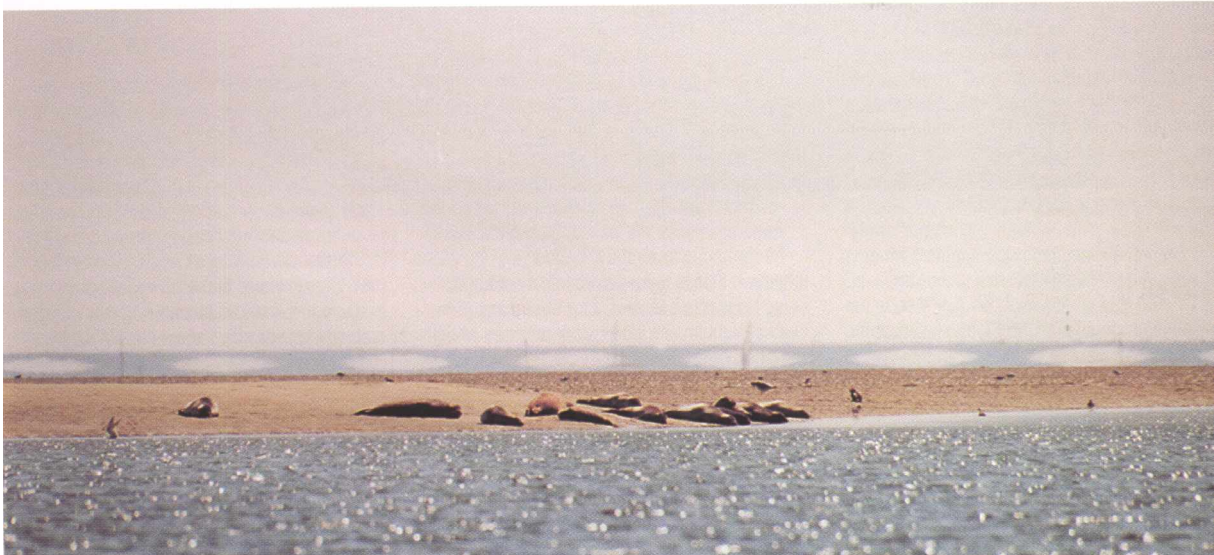
Seehunde auf den Ruhebänken in der Oosterschelde. Im Hintergrund ist die Seelandbrücke noch sichtbar

Nach der Schleuse und dem Roompotfahrwasser nehme ich Kurs auf den Geul von Banjaard, hier sollte man sich schon brav an die Betonnung halten, denn links und rechts ist es z.T.0,1m tief, bzw. bestimmte Bereiche fallen trocken.