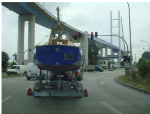
Stralsund – unterhalb der neuen Rügendammbücke

Daher beginne ich meinen Bericht mit der Überführung meiner „Scaun“ (Shark 24, Bau Nr. 1686, Baujahr 1981) von Neubrandenburg (südöstliches Meck–Pom) nach Stralsund und der darauf folgenden Segeltour „Rund Usedom“.