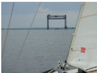
Monumentale Reste der ehemaligen Karniner Eisenbahn - Hubbrücke

gehen, was wir dann auch taten. Auf der Nordseite der Brücke gibt es die kleine „Horn“ – Schiffswerft mit einer Marina. Wir erfuhren dort, dass für die nächsten Tage viel Wind, für den Sonntag sogar Sturm angesagt worden war.