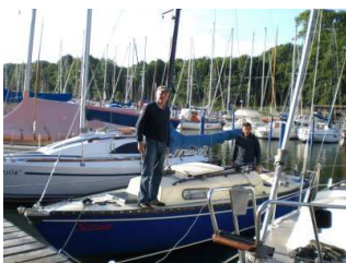
In Seedorf (Rügen)