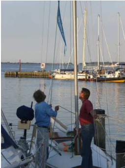
Hissen des „Blauen Bandes“ in Neuendorf (Hiddensee)