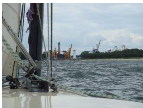
Einlaufen in Swinemünde

Wir setzten die Gastgeberlandflagge und liefen gegen 16. 00 Uhr unter Motor in Swinemünde ein.