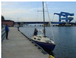
Warten auf die Brückenöffnung in Wolgast