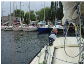
Ablegen in Swinemünde