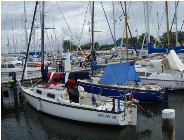
Zwei Sharks in der Marina Vitte-Langeort (Hiddensee)

Der Wind nahm zu und hinter der Wittower Fähre machten wir eine tiefschwarze bis an den Horizont reichende Wand aus. Es war kein Gewitter, aber wolkenbruchartige Regenfälle stürzten auf uns ein. Es tat im Gesicht und in den Augen weh. Die Sicht reichte kaum von einem zum anderen Tonnenpaar. Wir waren froh, dass bei dem kräftigen Gegenwind unser Motoren durchgehalten hatten. Als wir endlich in der Marina Vitte-Langeort auf Hiddensee festlagen, hatten wir bereits unseren Plan, weiter nach Stralsund zu segeln, aufgegeben.