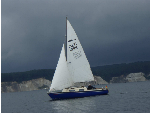
Die „Scaun“ vor Rügens Kreideküste

notiert: „Tolle Segeltour bei vormittags teilweise bedecktem Himmel, nachmittags Sonnenschein und Windstärken zwischen 3 bis 4 Bft. aus West“.