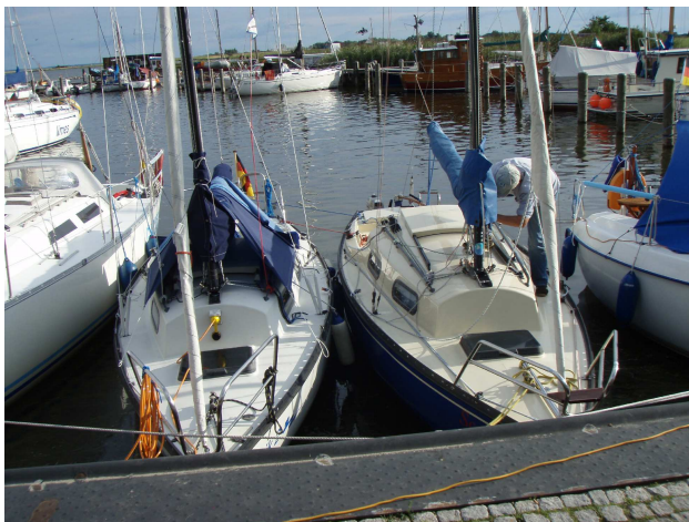
Zwei Sharks im Hafen von Kloster (Hiddensee)

Für den darauffolgenden Tag hatten wir uns ein Ziel in den inneren Rügenschon Boddengewässern vorgenommen, entweder Breege am gleichnamigen Bodden oder das weiter entfernte Ralswiek im Süden des Großen Jasmunder Bodden.