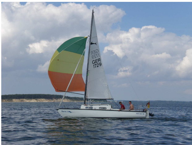
Die „Rerik 2“ auf dem Greifswalder Bodden

Gemeinsames Segeln hat den Vorteil, dass man von den Booten unter Segel Fotos machen kann.